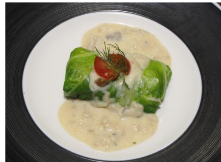
③白菜で包んだ海の幸のクリーム煮