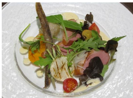
①合鴨スモークと根菜のサラダ仕立て

11月の主菜 ◆下記より1品お選びください◆ ★+500円で主菜をもう1品お選びいただけます★